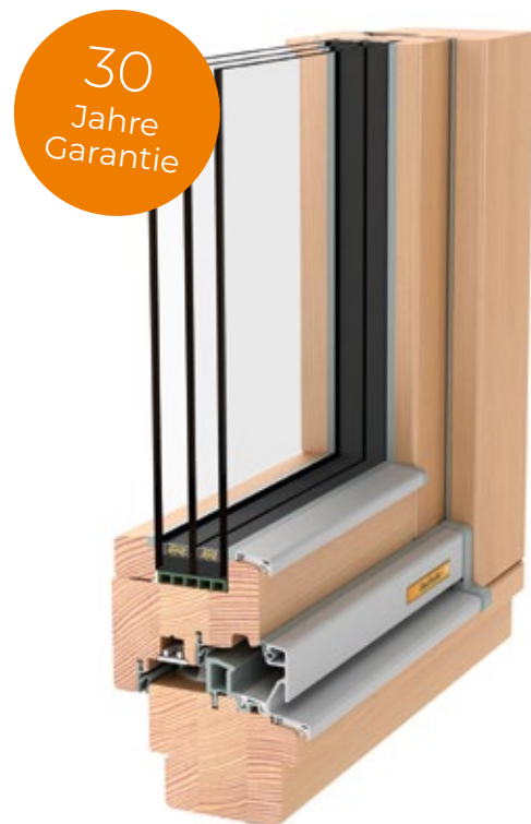
Holz NATURELINE 78