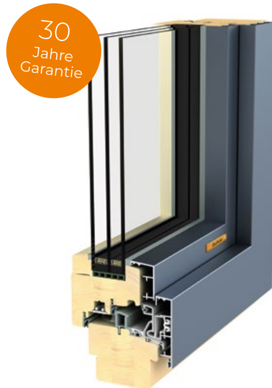
Holz-Alu FUSIONLINE 94