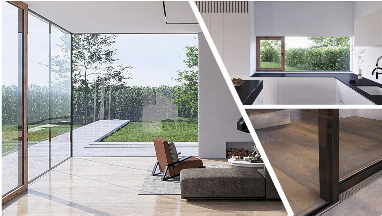
Durchsichtige Revolution: Gaulhofer GS-frame mit Hebeschiebetür und INLINE Fenster Astfichte „Wild sortiert“

Bei Einsatz von Fenster- und Schiebetürelementen wird das GS-frame auch als Blindstock verwendet, indem die Baubreite der Profile an die Baubreite der Einsetzelemente angepasst und die Glasdicke über den Scheibenzwischenraum reguliert wird. Gaulhofer-CEO Thomas Braschel: „Bei Gaulhofer GS-frame ist keine Kondensatentwässerung* erforderlich und auch keine Falzraumbelüftung* vorhanden!“