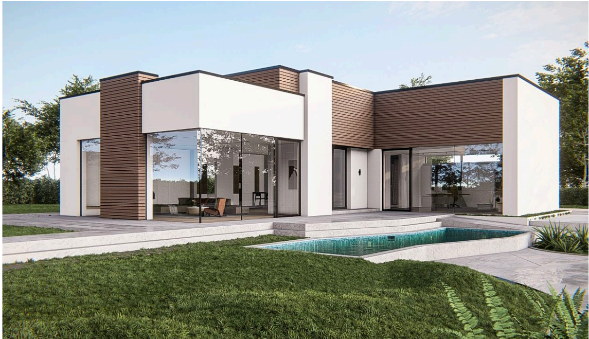
Gaulhofer zeigt im Nur-Glassystem Innovationskraft und lässt mit patentierter Lösung keine Wünsche mehr offen

Modernste Architektur erfordert neue Denkrichtungen. Innenbereiche verschmelzen mit der Umgebung, klare Linien dominieren die Formensprache. Innen wird zu außen, getrennt durch eine offensichtlich unsichtbare Nur-Glasfassade. So ermöglicht Gaulhofer GS-frame die Umsetzung nahezu jeder Gestaltungsidee. Das Besondere: Gaulhofer GS-frame ist innen und außen boden-, decken- sowie wandbündig und beeindruckt mit Wärmeisolation auf höchstem Niveau bzw. verblüfft zugleich mit bisher unerreichter Dichtheit ohne übliche Kondensationshürden.